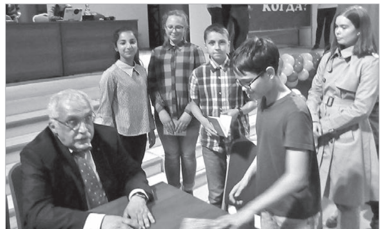
Автограф А. Друзя нашим игрокам